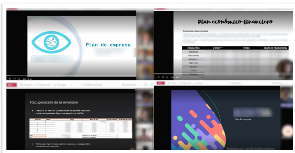
Figura n.º 1. Ejemplos de vídeo-presentaciones del alumnado