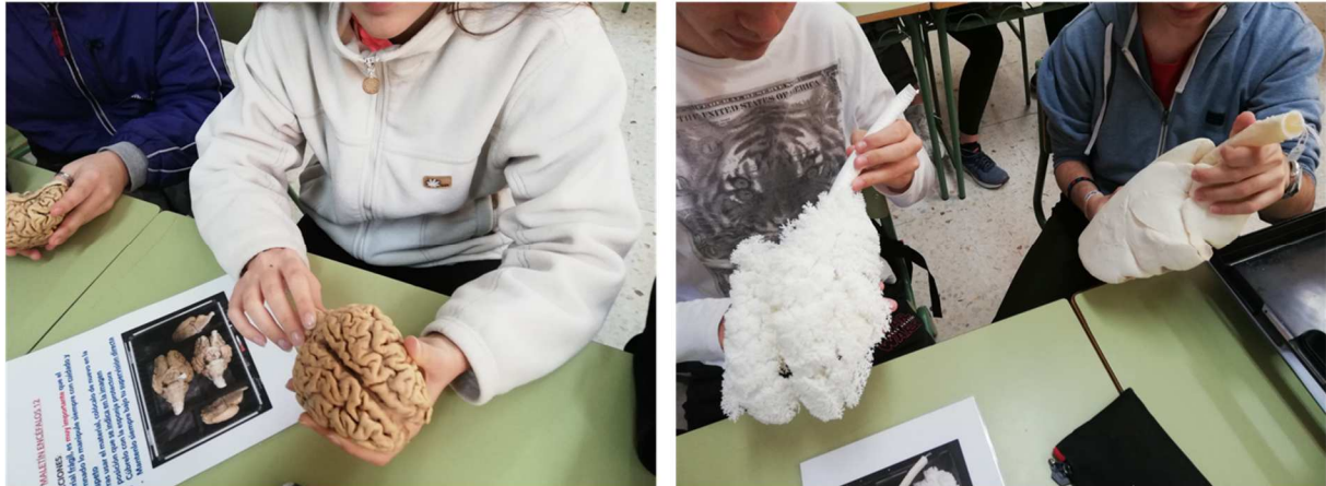
Figura 2: estudiantes utilizando órganos plastinados en clase

Los resultados de las encuestas de satisfacción del alumnado (n=72) se muestran en la Figura 3. Su percepción en relación con el uso de los órganos plastinados demostró que la experiencia de aprendizaje con estos materiales fue muy positiva. Así, en 7 de los 8 ítems de la encuesta se alcanzaron puntuaciones muy elevadas (> 4 puntos sobre un total de 5). El ítem que valora el potencial de los órganos plastinados para ser usados más allá de laboratorio no alcanzó 4 puntos (3,92), pero también se puede considerar altamente satisfactorio.