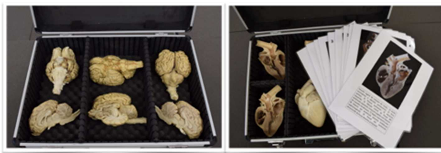
Figura 1: imágenes de dos maletines de órganos plastinados: a la izquierda de sistema nervioso central, y a la derecha de sistema circulatorio

Por su singularidad, son de destacar los maletines de órganos. Estos maletines son el medio por el cual se realizará la integración de los plastinados en las prácticas de Biología, de modo que el alumnado de los centros implicados en el proyecto tendrá acceso directo a todos ellos. Se contemplan 3 tipos de maletines. En cada uno de ellos se incluye una selección de órganos plastinados expresamente preparados para estudiar, desde diferentes puntos de vista, la anatomía de los sistemas circulatorio, respiratorio o nervioso. Además de los plastinados también se incluyen láminas fotográficas que actúan a modo de atlas anatómico (Figura 1).